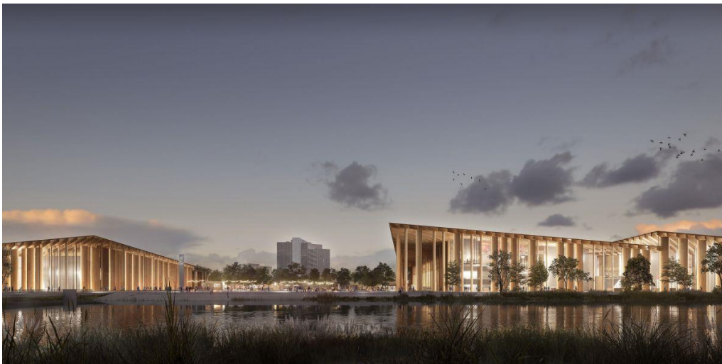
La vue sur le parvis du futur nouveau parc des expositions de Strasbourg, derrière le canal de dérivation. - Document Kengo Kuma & Associates - Image by Lunance.

Depuis le projet tombé à l'eau pour un coût trop élevé (180 millions d'euros) en 2014, le nouveau Parc des expositions a été largement revu à la baisse. D'une capacité d'exposition totale de près de 26.000 m 2 et d'une surface de 22.000 m 2 dédiée au parking (dont 900 places couvertes) pour 58.000 m 2 de bâti au total, son budget sera cette fois de 86 millions d'euros.