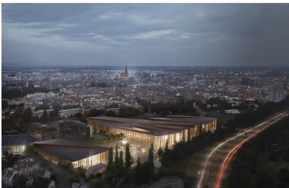
Vue aérienne sur le projet du nouveau parc des expositions de Strasbourg. Document Kengo Kuma & Associates - Image by Lunance.

Mardi 18 septembre 2018 à 11h34 | Par Bruno Poussard