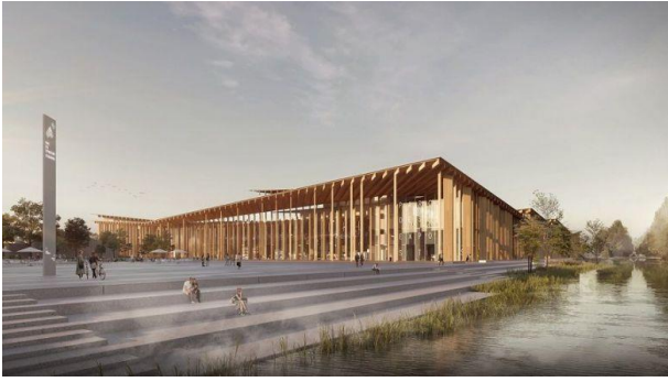
Sur le parvis du futur parc des expositions de Strasbourg. Document Kengo Kuma & Associates Image by Lunance.